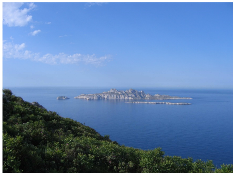
Archipel de Riou

La réglementation en vigueur sur ce site est maintenue et renforcée par la réglementation du Parc national des Calanques.