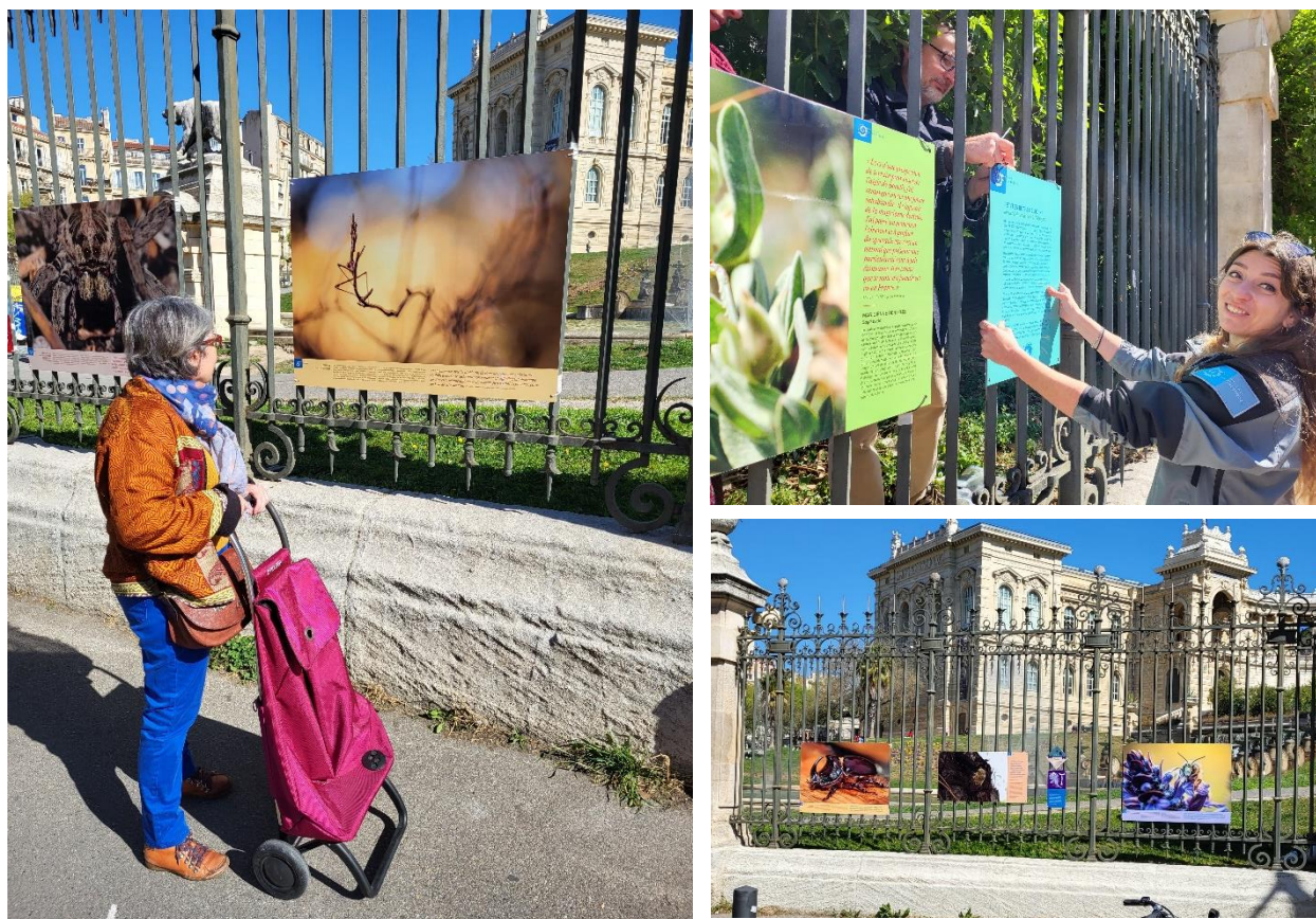
Montage et premiers visiteurs de l'exposition Petites bêtes de scène

Restez connecté à l'actualité du Parc national pour ne rien manquer !